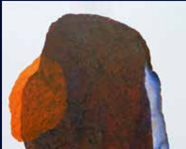
Elke Albrecht, Growing 648, 2021, Acryl auf Leinwand, 80 x 100 cm

Elke Albrechts Werke von außergewöhnlicher Subtilität changieren zwischen Grafik und Malerei. Die nuancenreiche Farbgebung in additiver oder subtraktiver Farbmischung, die zarte Strichführung der Bleistiftlinien, die gegen scharfe Konturen gesetzten Schattierungen, erzeugen ein inneres Bild oder Empfinden von Leichtigkeit und Nähe oder auch Schwere und Bedrängtheit.